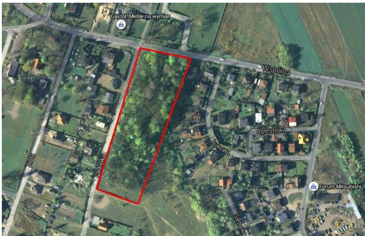
Zieleń na obszarze opracowania

Obecnie w części południowej - w miejscu wskazanym przez Wojewódzkiego Konserwatora Zabytków jest możliwość lokalizacji budynku mieszkalnego dla właściciela- teren nie jest zadrzewiony, a w najbliższym sąsiedztwie nie znajdują się cenne okazy.