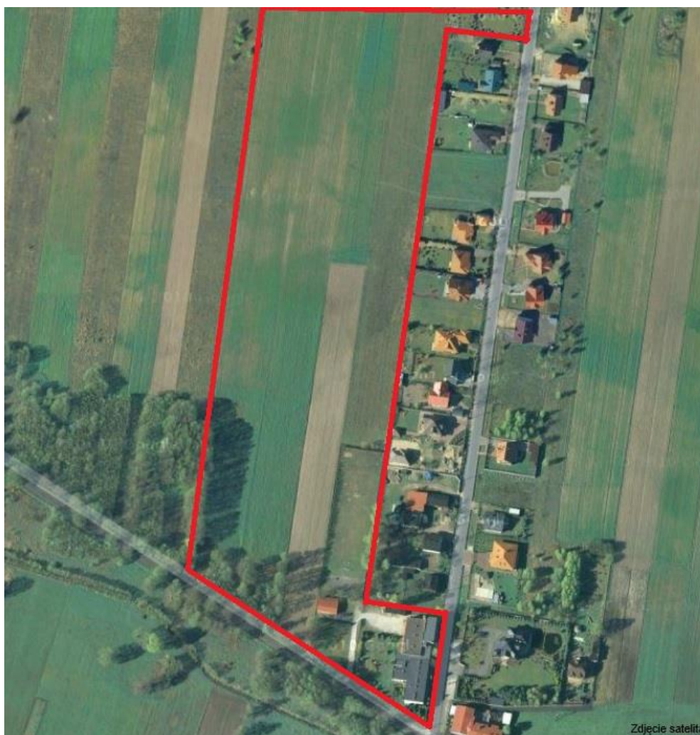
Zieleń na obszarze opracowania

Obszar objęty projektem zmiany planu charakteryzuje się występowaniem roślinności łąkowej. Reszta to tereny upraw rolnych, miejscami skupiska roślinności wysokiej – zadrzewienia i zieleń przydomowa.